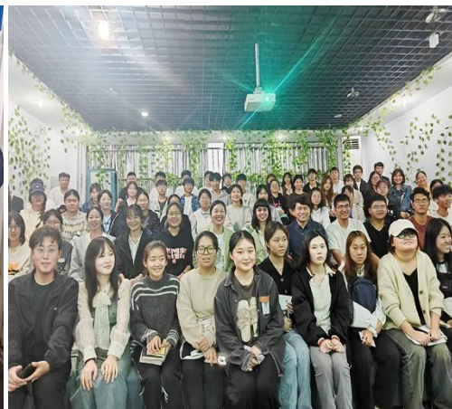
传递部门动态 服务教学科研