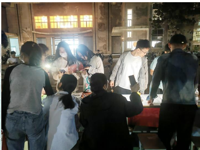
弘扬传统文化 推动全民阅读