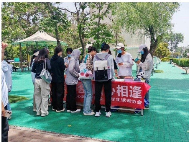
传递部门动态 服务教学科研