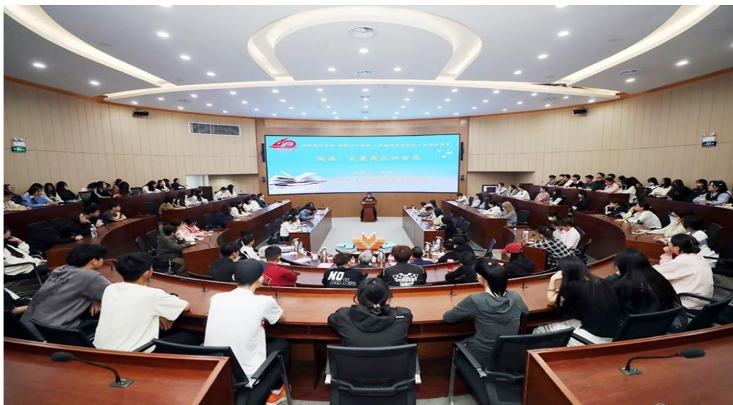
(中原学研究院院长樊洛平教授 供稿)