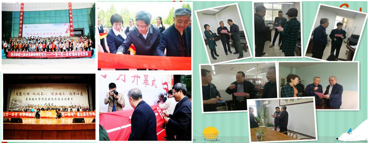
第九届读书月倡议“一生一月一本书”